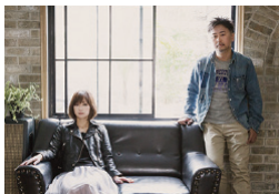
Do As Infinity ▶1.13(fri)