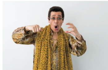
スペシャルゲスト ピコ太郎