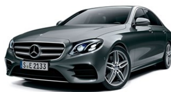
メルセデスベンツ Eクラス