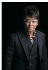
東京オートサロン 2017 アンバサダー 哀川 翔