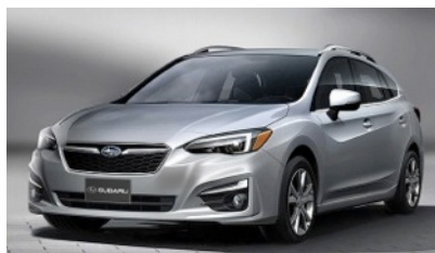
スバル インプレッサ

つきましては、ご取材を賜りたくお願い申し上げます。ご取材の申請は、現在オフィシャルサイト内のメディアページ( www.tokyoautosalon.jp/2017/media/ )にてお受けしています。