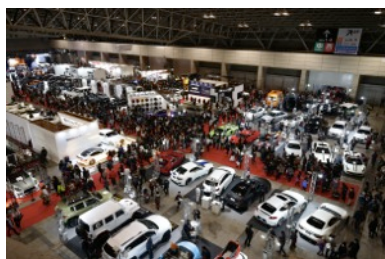
東京オートサロン 2016 会場風景